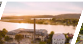
Campus Valdivia, Sede Valdivia.