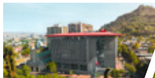
Campus Bellavista, Sede Santiago.

Folleto actualizado a mayo 2019. Información válida Admisión 2019.