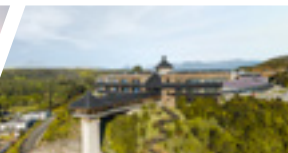
Campus Puerto Montt, Sede De la Patagonia.

5 ACREDITADA GESTIÓN INSTITUCIONAL DOCENCIA DE PREGRADO VINCULACIÓN CON EL MEDIO DESDE SEPT. 2016 HASTA SEPT. 2021