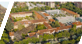
Campus Los Leones de Providencia, Sede Santiago.