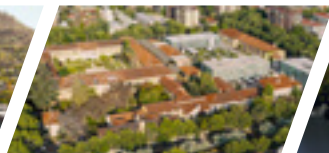
Campus Los Leones de Providencia, Sede Santiago.