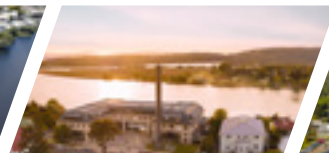
Campus Valdivia, Sede Valdivia.