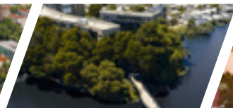
Campus Las Tres Pascualas, Sede Concepción.