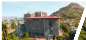
Campus Bellavista, Sede Santiago.

Folleto actualizado a mayo 2019. Información válida Admisión 2019.