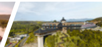
Campus Puerto Montt, Sede De la Patagonia.

5 ACREDITADA GESTIÓN INSTITUCIONAL DOCENCIA DE PREGRADO VINCULACIÓN CON EL MEDIO DESDE SEPT. 2016 HASTA SEPT. 2021