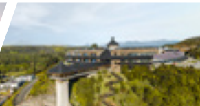
Campus Puerto Montt, Sede De la Patagonia.

5 ACREDITADA GESTIÓN INSTITUCIONAL DOCIENCIA DE PREGRADO VINCULACIÓN CON EL MEDIO DESDE SEPT. 2016 HASTA SEPT. 2021