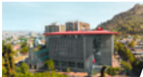
Campus Bellavista, Sede Santiago.

Folleto actualizado a mayo 2019. Información válida Admisión 2019.