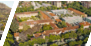
Campus Los Leones de Providencia, Sede Santiago.