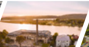
Campus Valdivia, Sede Valdivia.